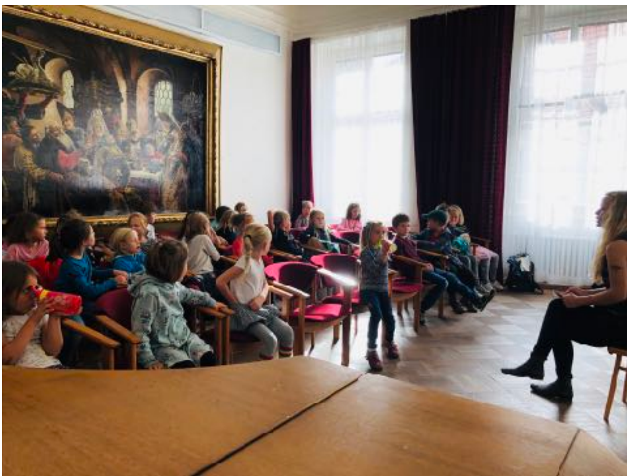
zkouška sboru v komorním sále KJD

Činnost sboru Bežnot byla v tomto akademickém roce uskutečňována ve čtyřech skupinkách. Dvě skupinky mladších dětí se scházely jednou týdně v podkrovním prostoru Divadla Kampa. Kurzy pro dvě skupinky pokročilejších zpěváků probíhaly taktéž jednou týdně, nově v prostorách Konzervatoře Jana Deyla na Malé Straně.